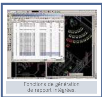
Fonctions de génération de rapport intégrées.