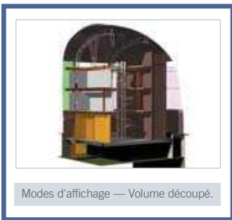
Modes d'affichage — Volume découpé.